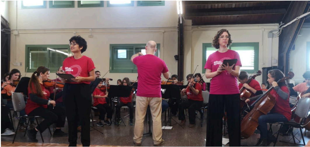
Concert la Riborquesta fa òpera. Escola Pere Vila. Desembre 2023.