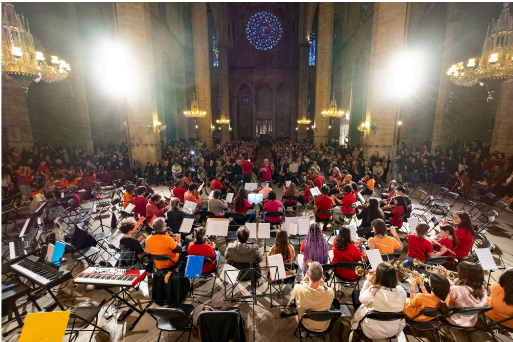
Concert la Riborquesta fa òpera. Església de Santa Maria del Mar. Març 2024.