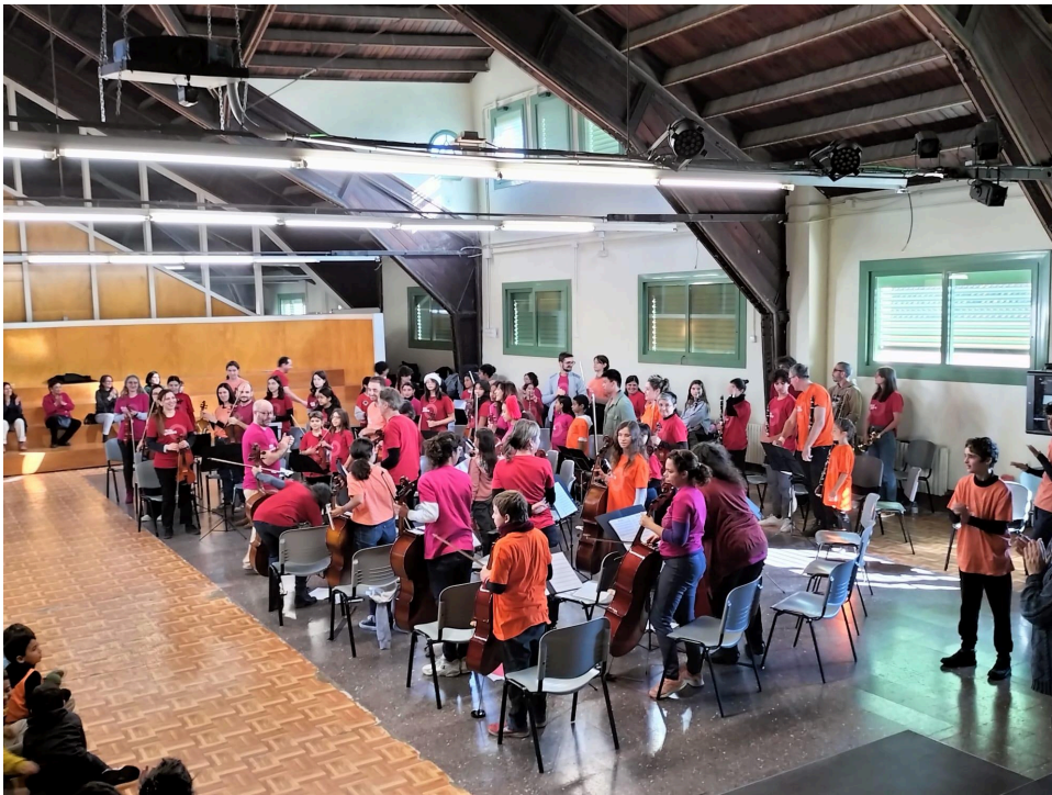
Concert la Riborquesta fa òpera. Escola Pere Vila. Desembre 2023.