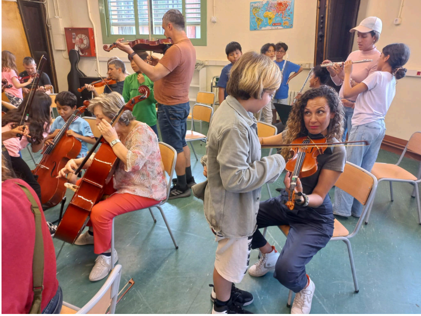
Concert i classe oberta dels alumnes de l'Escola Pere Vila i les seves famílies. Maig 2024.