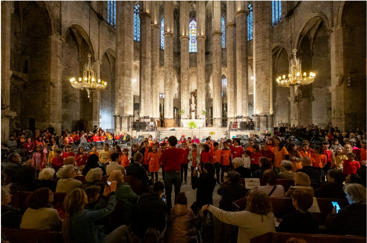
Concert la Riborquesta fa òpera. Església de Santa Maria del Mar. Març 2024.