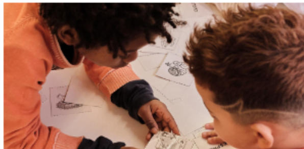
A l'escola Cervantes hi ha 228 nens, de 3 a 12 anys, que parlen 18 llengües diferents al país (Araucan)

• L'escola Cervantes participa de les imatges per motivar l'expressió oral i escrita