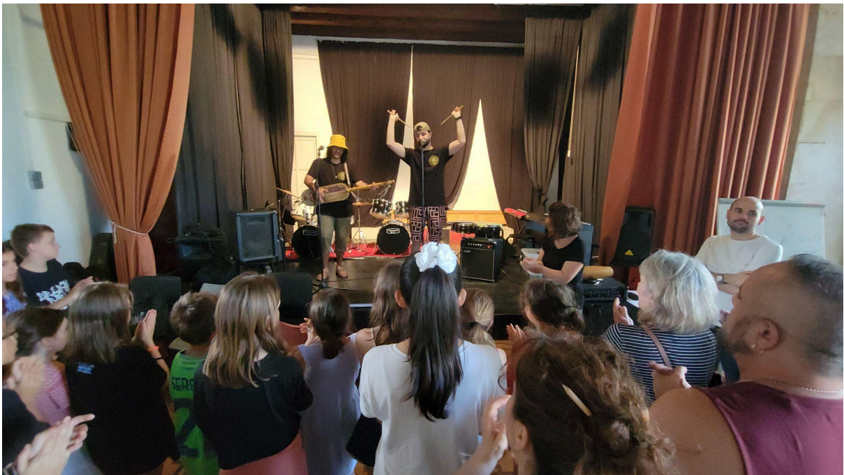
Casal Musical, juny 2024. Institut Verdaguer