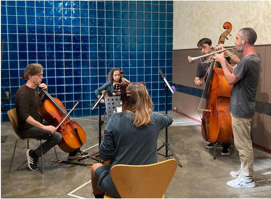
II Jornada Càtedra Pau Casals