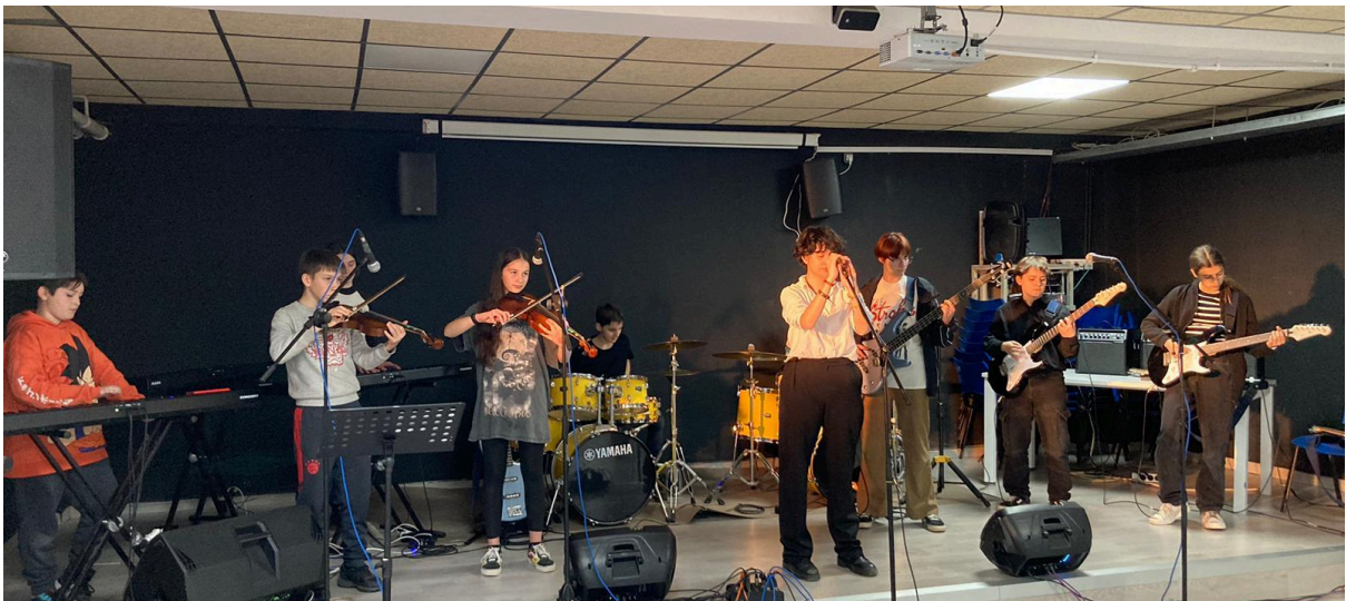
TroBa. Trobada dels grups que formen part del programa d'En Directe. Combo de l'Institut Verdaguer. Institut Barri Besòs. Març 2024.