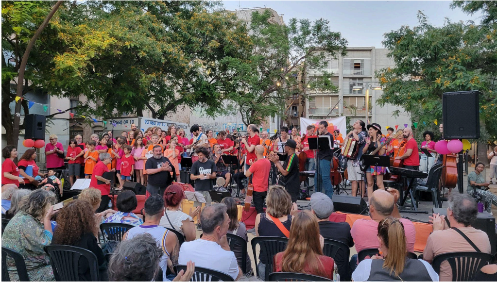
MercArt 2024 a la Plaça del Pou de la Figuera