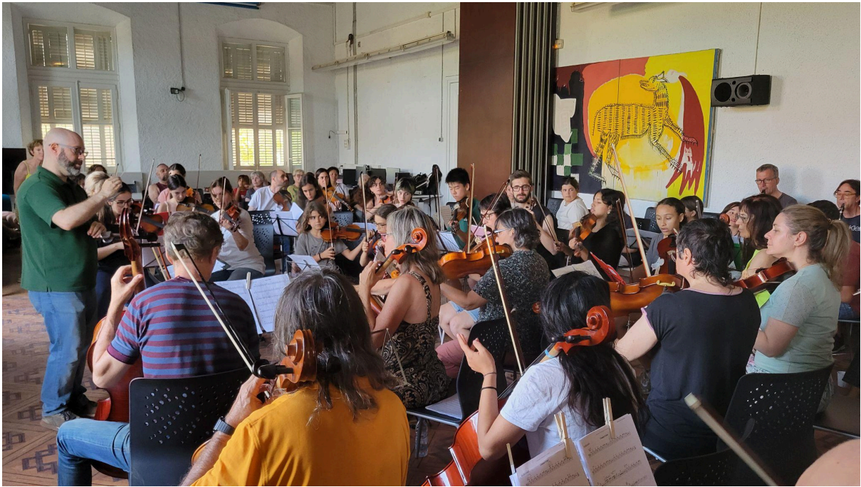
Casal Musical, juny 2024. Institut Verdaguer