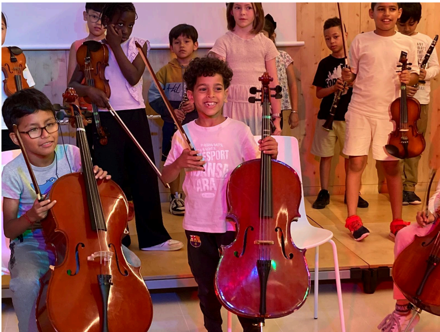
Cloenda Escola d'Envel·liment actiu a càrrec dels alumnes de l'Escola Cervantes. Centre de dia de gent gran del barri. Maig 2024.