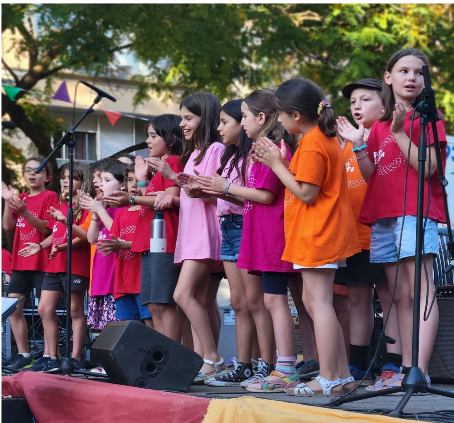
MercArt 2024 a la Plaça del Pou de la Figuera