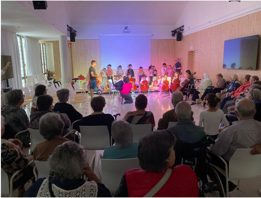
Cloenda Escola d'Envel·liment actiu a càrrec dels alumnes de l'Escola Cervantes. Centre de dia de gent gran del barri. Maig 2024.