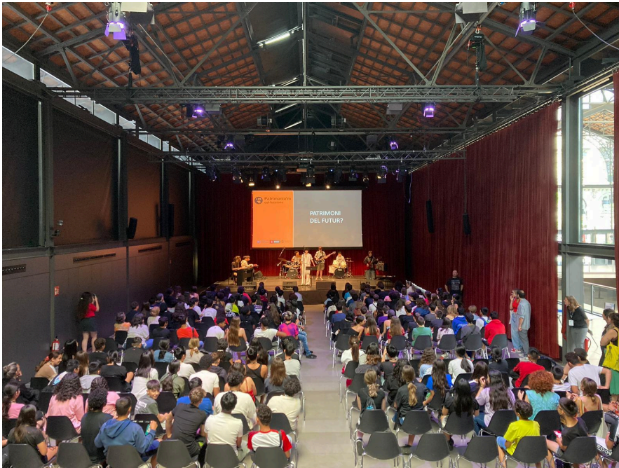
Cloenda de les jornades Patrimoniám a càrrec del combo de l'Institut Verdaguer. El Born centre de cultura i memòria. Maig 2024.