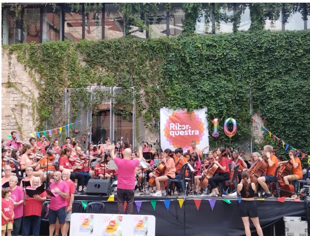
MercArt - La Riborquesta fa 10 anys.