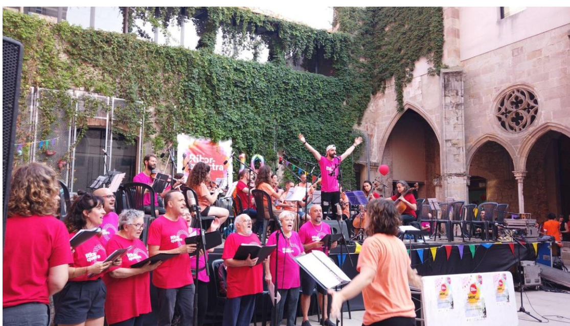
MercArt - La Riborquesta fa 10 anys.