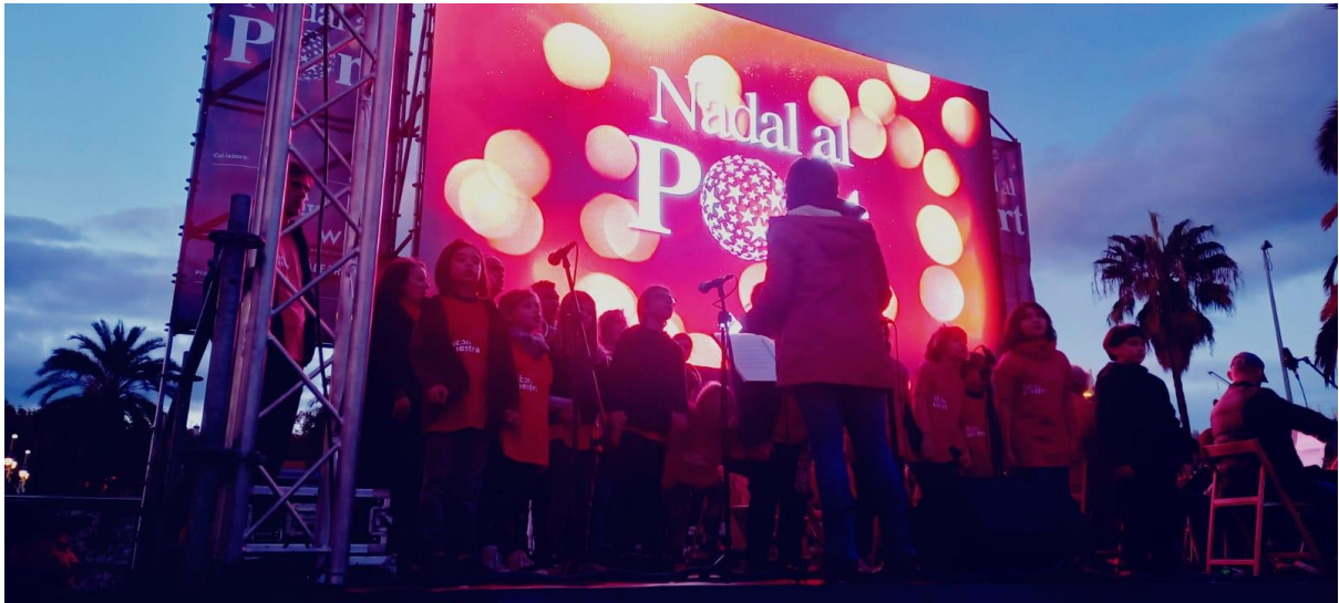
Concert a la fira de Nadal del Port Vell.