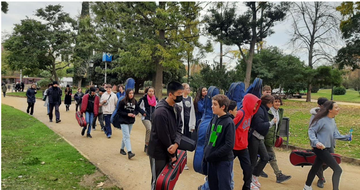
Trasllat dels alumnes de l'Institut Verdaguer al concert de l'Escola d'Envel·liment Actiu.