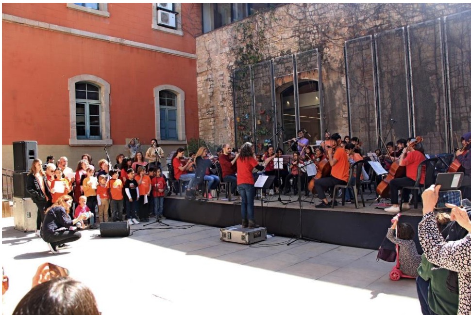
Concert pel centenari de l'Agrupació Cultural Folklorica de Barcelona.