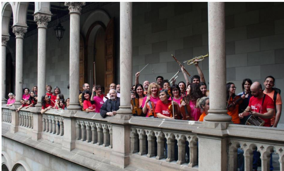
Concert 9es jornades d'intercanvi d'experiències d'aprenentatge (Centre Promotor d'Aprenentatge-Servei).