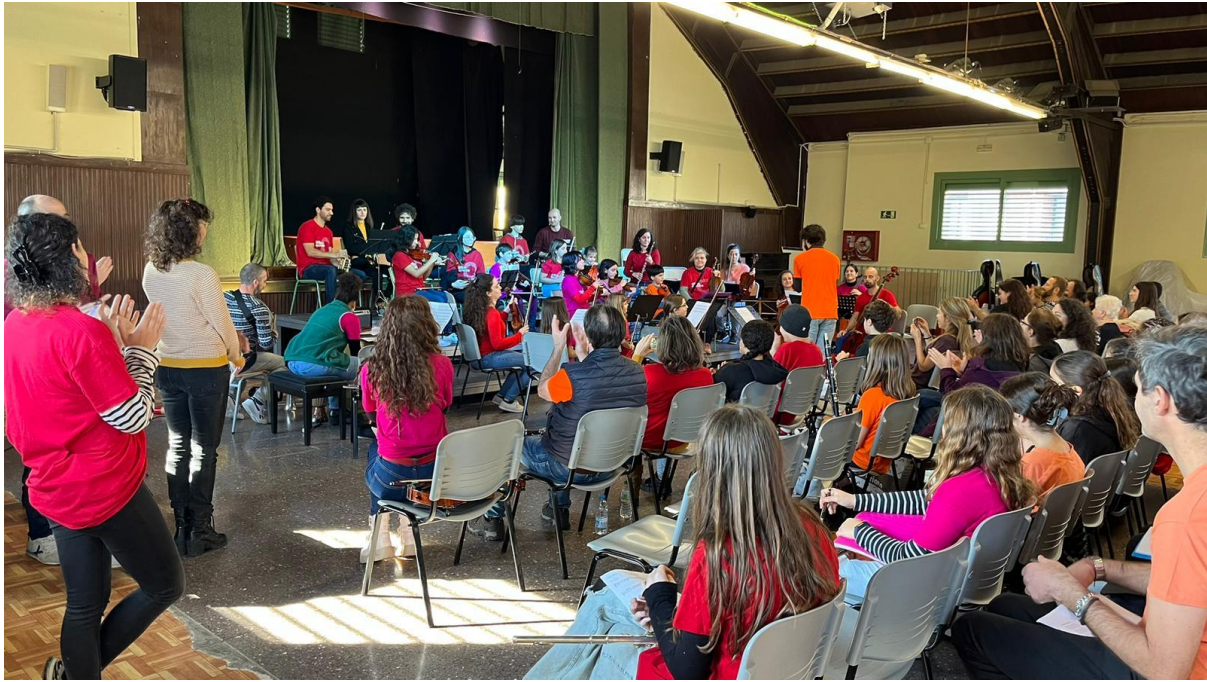
Concert d'hivern "músiques d'arreu" a l'Escola Pere Vila.