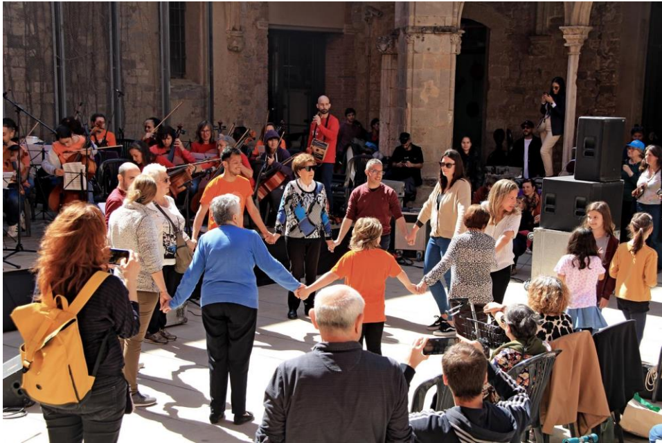
Concert pel centenari de l'Agrupació Cultural Folklorica de Barcelona.